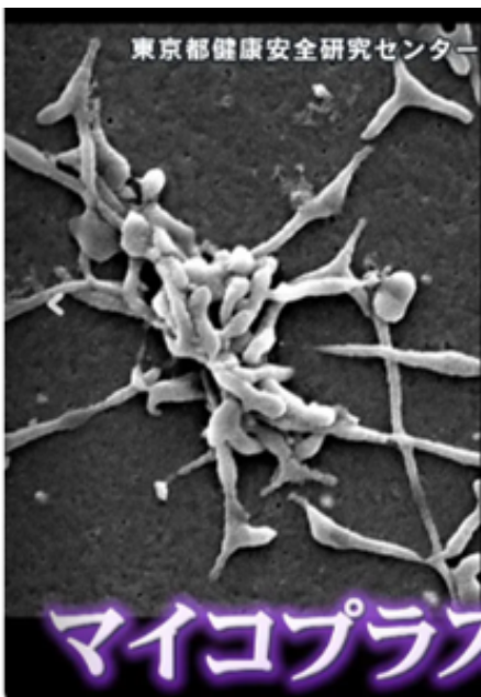
マイコプラズマ肺炎