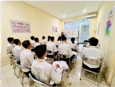
組合の授業でマナーを教える